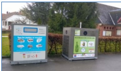
Parking de la mairie

2 Containers à votre disposition dans le village