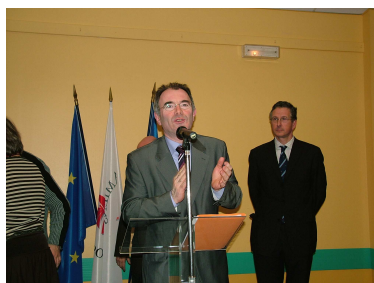
Cérémonie des vœux du maire janvier 2007