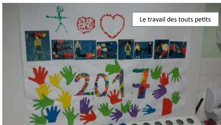
Le travail des touts petits