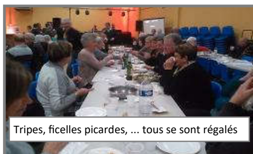
Tripes, ficelles picardes, ... tous se sont régalés

Un grand merci aux bénévoles et participants à ce téléthon 2017