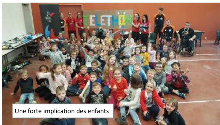
Une forte implication des enfants