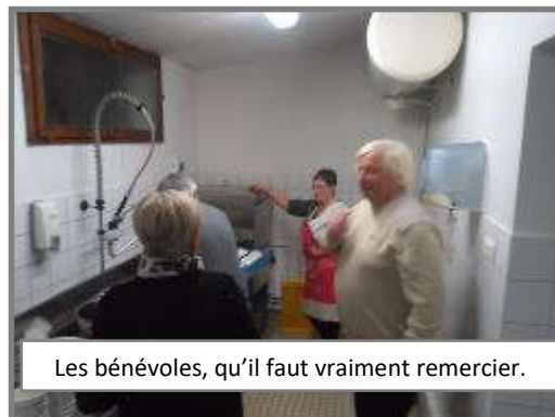
Les bénévoles, qu'il faut vraiment remercier.