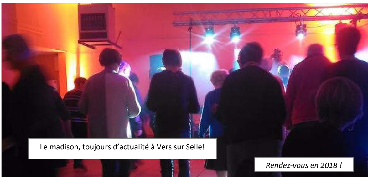
Le madison, toujours d'actualité à Vers sur Selle!