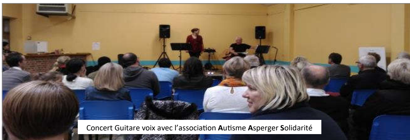
Concert Guitare voix avec l'association Autisme Asperger Solidarité