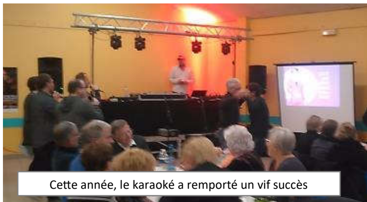
Cette année, le karaoké a remporté un vif succès