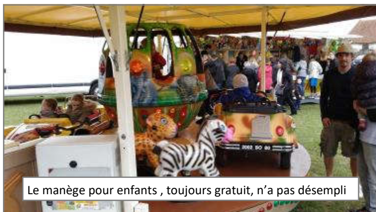
Le manège pour enfants , toujours gratuit, n'a pas désempli