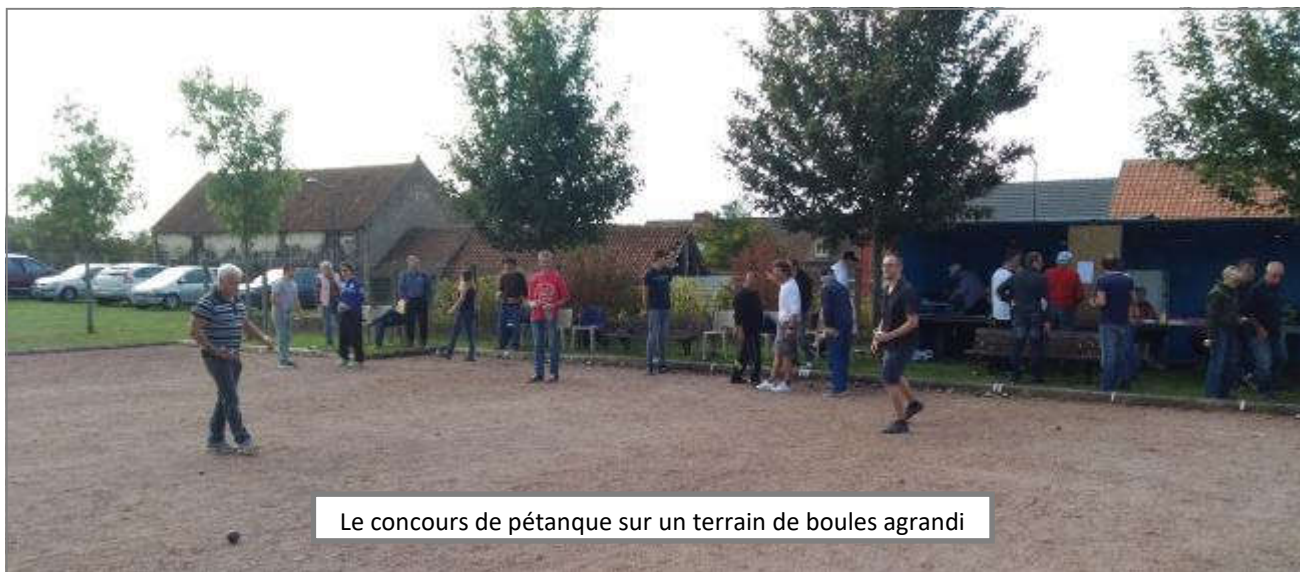
Le concours de pétanque sur un terrain de boules agrandi